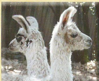
A.L. Pretty Colors & A.L. Jean Harlow